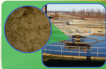
One of our secondary clarifiers and the bitty-bugs that return to our bio reactors to keep treating wastewater!

In January we celebrated the 3 year anniversary of our secondary treatment system! Each element of our plant works together to ensure the water returned to the Petitcodiac is the cleanest possible, and the secondary clarifiers are a big part of that. They allow the Suspended Solids to settle and be recycled back into our bioreactors. The surface effluent proceeds to disinfection by UV treatment. To learn more visit transaqua.ca